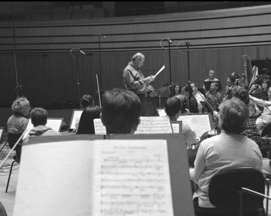
Iván Fischer