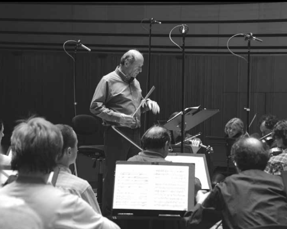
Iván Fischer